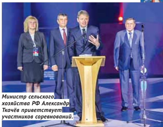
Министр сельского хозяйства РФ Александр Ткачёв приветствует участников соревнований.