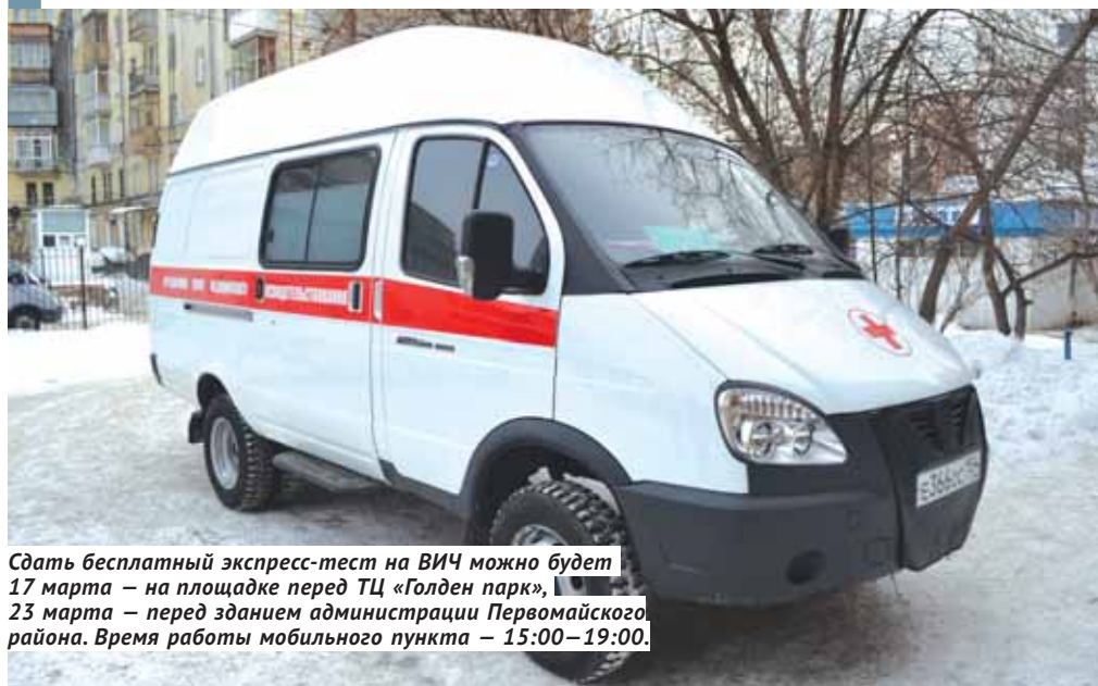
Сдать бесплатный экспресс-тест на ВИЧ можно будет 17 марта — на площадке перед ТЦ «Голден парк», 23 марта — перед зданием администрации Первомайского района. Время работы мобильного пункта — 15:00–19:00.

Замминистра здравоохранения Новосибирской области Ярослав Фролов уточняет, что сегодня всем пациентам с ВИЧ препараты выдаются на месяц лечения. И это не связано с нехваткой лекарств: такой срок установлен для того, чтобы «оценить качество терапии и при отсутствии эффекта и результата лечащему врачу иметь возможность оперативно изменить схему лечения».