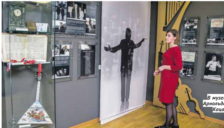
В музее Арнольда Каца.

— В этом году филармония устраивает концерты с исполнением сочинений сибирских композиторов. Сегодня организа-