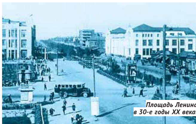
Площадь Ленина в 30-е годы XX века.

Новосибирск в первые месяцы войны вместе с другими предприятиями был эвакуирован и Ленинградский завод им. Коминтерна. Его цеха разместились в нынешнем кинотеатре «Победа». Там же, а также в помещениях водного института, стали жить семьи приехавших ИТРов. Рабочих по объявлению набирали уже на месте.