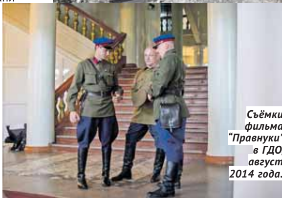
Съёмки фильма «Правнуки» в ГДО, август 2014 года.

дорогостоящих мероприятий по их усилению». Для того чтобы снизить затраты, была предложена концепция частичного демонтажа здания. Взамен будет возведена часть с металлическим каркасом, а на первом этаже планируется построить парковку. Не исключено, что обновлённое зда-