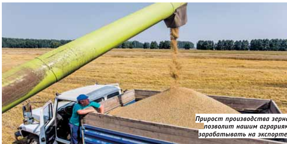
Прирост производства зерна позволит нашим аграриям зарабатывать на экспорте.

— В прошлом году Россия произвела 119 миллионов тонн зерна, — сказал Ткачёв. — Это один из лучших результатов в нашей истории, но Китаю и США мы уступаем в три-четыре раза. Догнать их в обозримом будущем нереально, но на ближайшее десятилетие мы ставим задачу выйти на 150 миллионов тонн. Эту прибавку получить несложно — многие до сих пор сеют без внесения достаточного количества удобрений, а ведь плюс даже в три центнера с гектара даст боль-